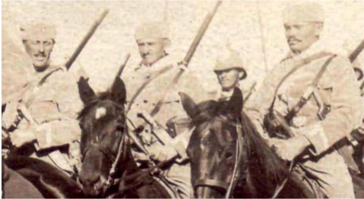
Darstellung der einzelnen Uniformepochen zur Landesausstellung und gleichzeitigem 25jährigen Schutztruppenjubiläum im Mai 1914. Am Koppel Revolver M/83 und das Bowiemesser.